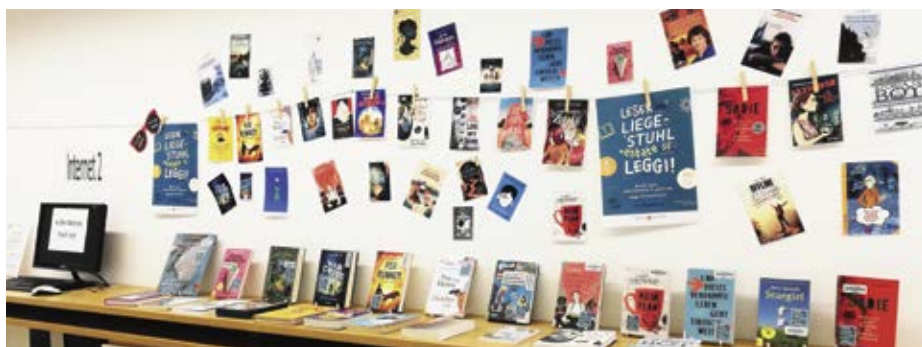
De bieci libri nueves iel sën da abiné tla Bibliotech San Durich.

Giut à la popolazion de Urtijëi messù resté zënza liber, avisa te n tēmp ulache la ëssa povester abù plu dl'aurela de liejer che zënza. Nscila ie l servisc che la Bibliotech ti à pità ala jënt, de ti mené i libri a cësa, unì tēut su cun gran plajëi.