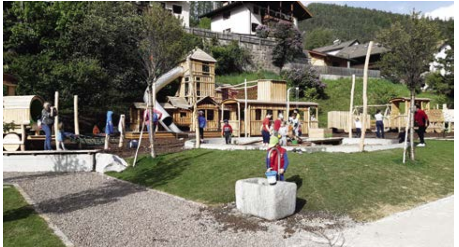
Der neue Spielplatz auf dem Col da Brida kommt bei Kindern und Eltern sehr gut an.

Umwelt liegen zu lassen. Gemeindepolizisten werden verschärft Kontrollen durchführen.