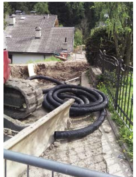
Tla streda Zitadela vëniel fat nfrastutures nueves.