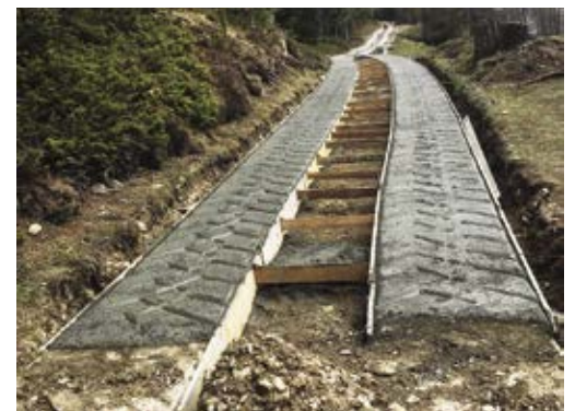
Per la cuntreda ie peton mic che asphalt, nscila dij la cumiscion pruvenziela per l ambient.