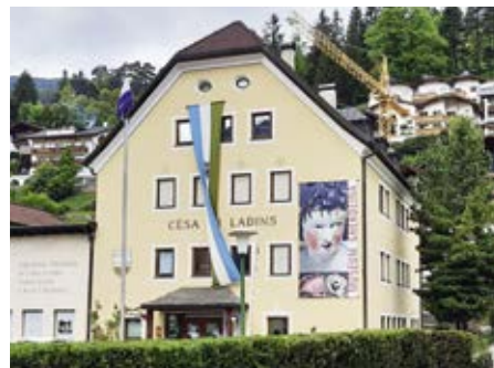
La Cësa di Ladins - cialerala pa tosc ora autramënter?

Nchin a ntlëuta laureran inant per stlari n vagun ponc dl cuntrat danter Chemun y Union di Ladins de Gherdëina y sambën cialeran inant, cun la provinzia, la region y i