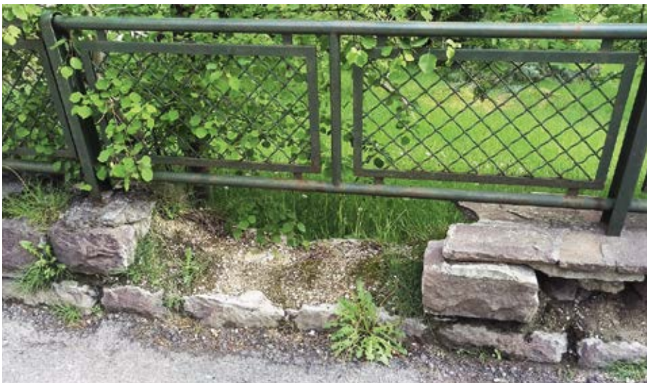
Pra l vedl mur da Doss via iel gran ëura de fé zeche.