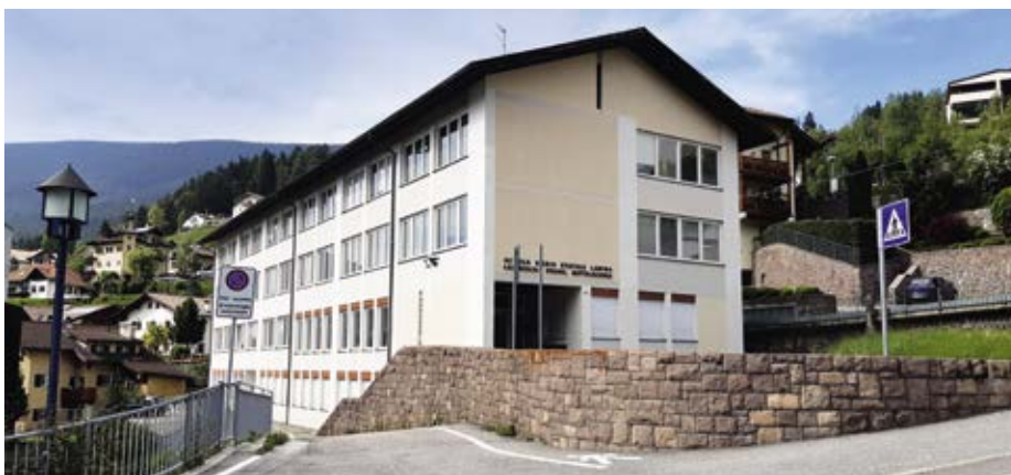
Im heurigen Sommer werden die zwei oberen Stockwerke und das Sekretariat umgebaut.