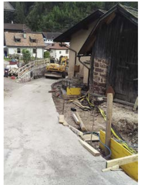
Pra la streda Roma da Maidl ju vëniel bele laurà sterch.

Sambën che ntan l ann se portel nce for pro de mëndri y de majeri lëures de präscia che n cëla sambën de mené inant per l bën de nosc luech.