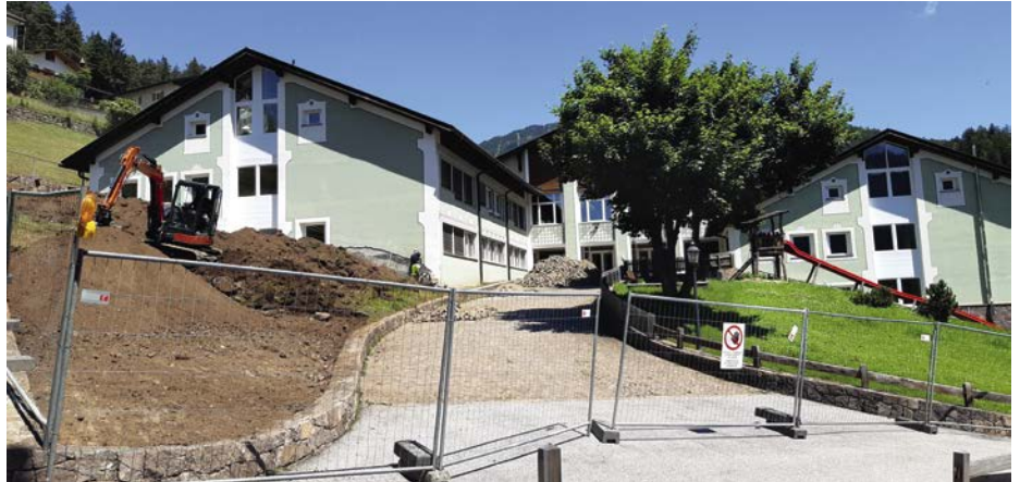
Der Bereich beim Haupteingang wird neu gestaltet.

spricht“, so Vizebürgermeisterin Lara Moroder, „es werden wenige Spielgeräte aufgestellt, um möglichst viel Freiraum für die Kinder zu belassen.“