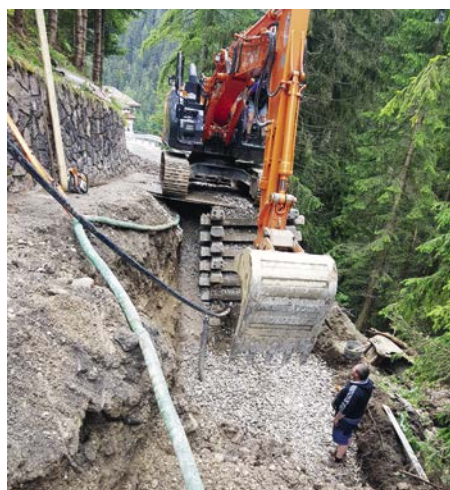
I lavori sulla streda Paul sono già iniziati.

Kostenlose Antragstellung über das Patronat KVV-Acli, bitte Termin vereinbaren! www.mypatronat.eu