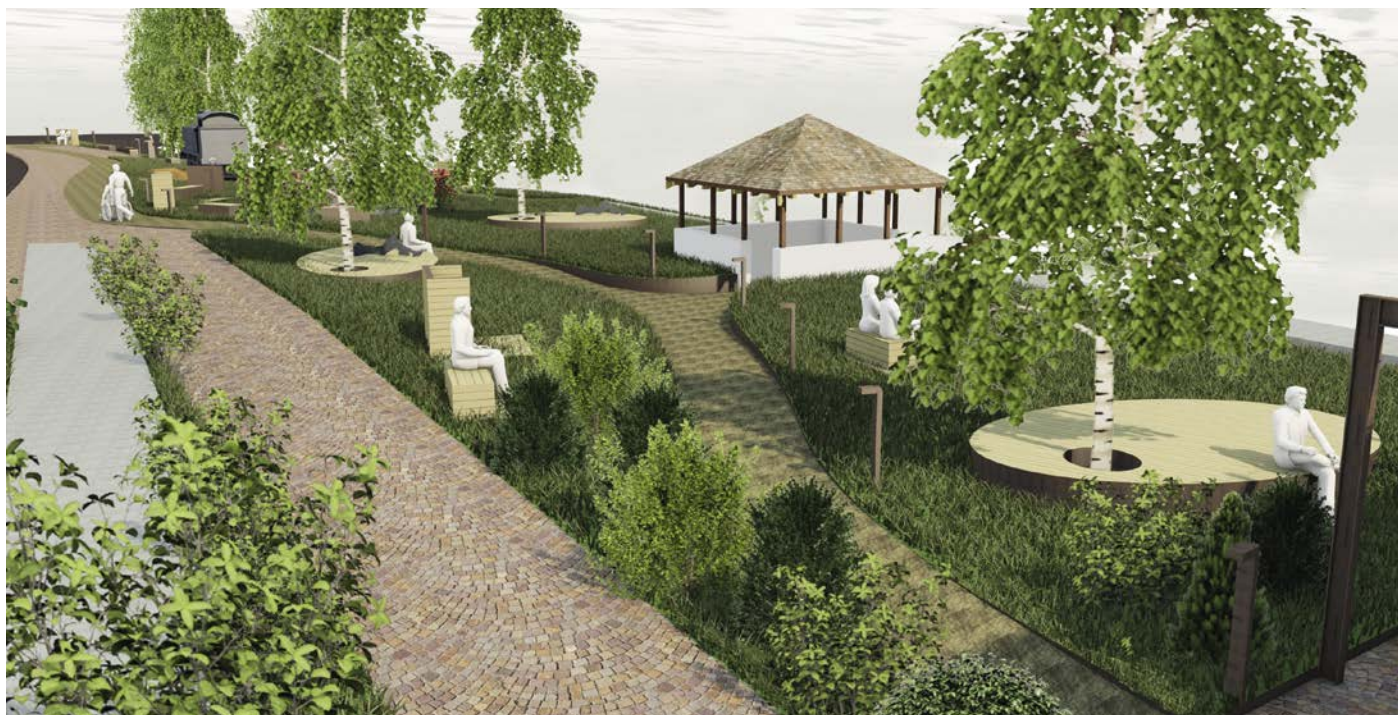
So soll der Park in Zukunft aussehen.

In totale i costi dei lavori prevedono la spesa di 515.000 € oltre le somme a disposizione dell'Amministrazione. Fra poco verrà consegnato il progetto esecutivo e dunque sarà bandito un concorso per la concessione dei lavori. Il progetto è stato coordinato dall'ingegner Siegfried Comploti.