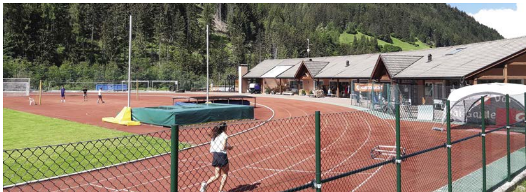
De plu atlec se noza bele dla plaza dal Sport Mulin da Coi.

almanco doi grupes y for mantenian la destanza danter i atlec. Purtrüep ne possen mo nia fé la duscia, se nuzé di locai da se mudé y nianca dla palestra, chësc ne lascia i decrec dl stat y dla provinzia mo nia pro. Mpurtant iel ënghe de rujené danora cun l vardian dl mplant, acioche èl sebe for chi che ie sun l ciamp.