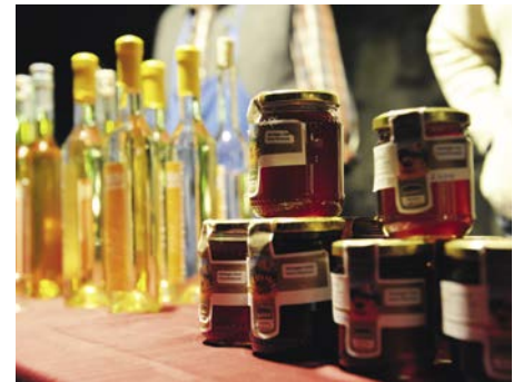
L marcià di paures y di artejans y la festa dla nëif ie doi manifestazions mpurtantes per S.Cristina.