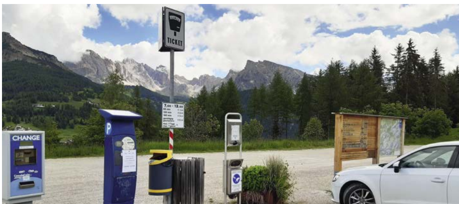
I parcheggi al Monte Pana dal 1° luglio al 15 di settembre sono a pagamento dalle ore 7 alle ore 13.