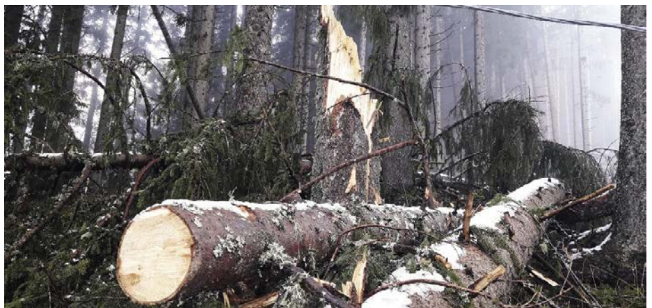
Im Raschötzerwald hat der Schneefall im vorigen November großen Schaden angerichtet.

bei Christ da Sacun eine Variante gebaut, um den Verkehr von Traktoren und Geländewägen zu erleichtern. Diese Arbeiten wurden von der Forstbehörde übernommen.