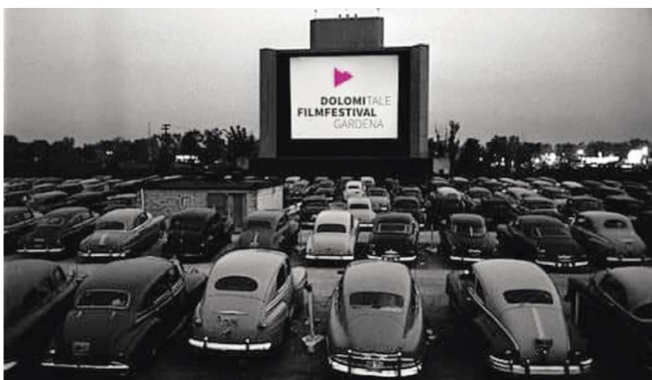
Via n Setil uniral a s'l dé n autochino coche chësc.