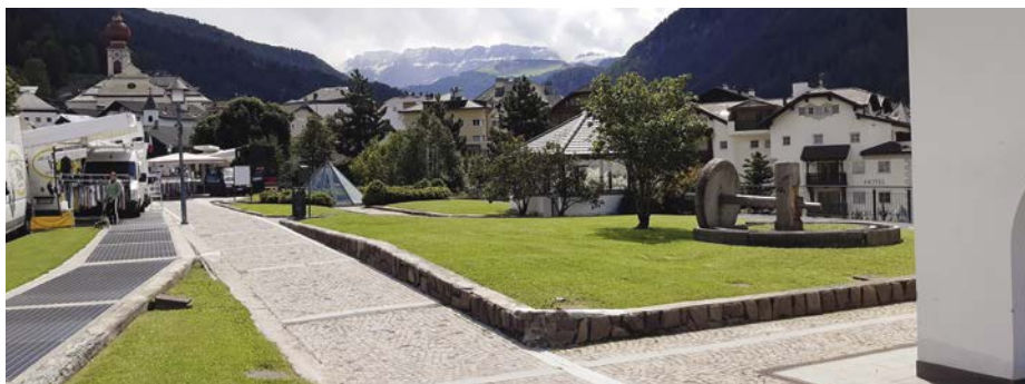
Aktuell sieht der Park vor dem Altersheim so aus.

I lavori si sono resi necessari a causa delle infiltrazioni d'acqua che oramai da anni rovinano il garage, edificato ca. 20 anni fa. Come ci espone il sindaco, la conformazione "a camino" del garage porta in inverno a temperature molto fredde all'interno causando danni alle grondaie e agli scoli dell'acqua. Per evitare danni più consistenti alle strutture portanti del garage si è deciso di asportare tutta la copertura del garage nell'area tra la sala Ghisela e la cupola in vetro e di rifare in questo tratto tutta la guaina e tutta la copertura per impermeabilizzare il garage sottostante. Nell'ambito di questi lavori necessari si è deciso anche di ristrutturare tutta l'area fino alla rotonda Purgher per una superficie di ca. 1.700 m 2 . Oltre all'isolamento e all'impianto di drenag-