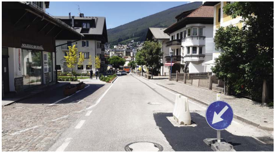
Tla streda Rezia ie i lëures per mëter ju la fibra otica bele stluc ju.

plu aut, ajache n messerà paiè i cosc efetifs di lëures. Da lecurdé iel che uniun che à apustà la fibra otica muessa se cruzië nstës de mëter ju na rola ueta sun si grunt, y plu avisa dala sëida dl grunt cumenel nchin te cësa. Tla cëses uniral pona metù na pitla zentrela (tlameda BEP), pra chëla che l unirà tacà ite i cabli dla fibra otica.