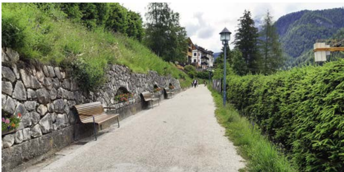
Im Bereich der Curta und der Promenade wurden neue Bänke angelegt.

Wie auch in den letzten Jahren erfolgt die Aufteilung der Arbeiten zwischen Gemeinde und Tourismusverein sehr gut, Dank der