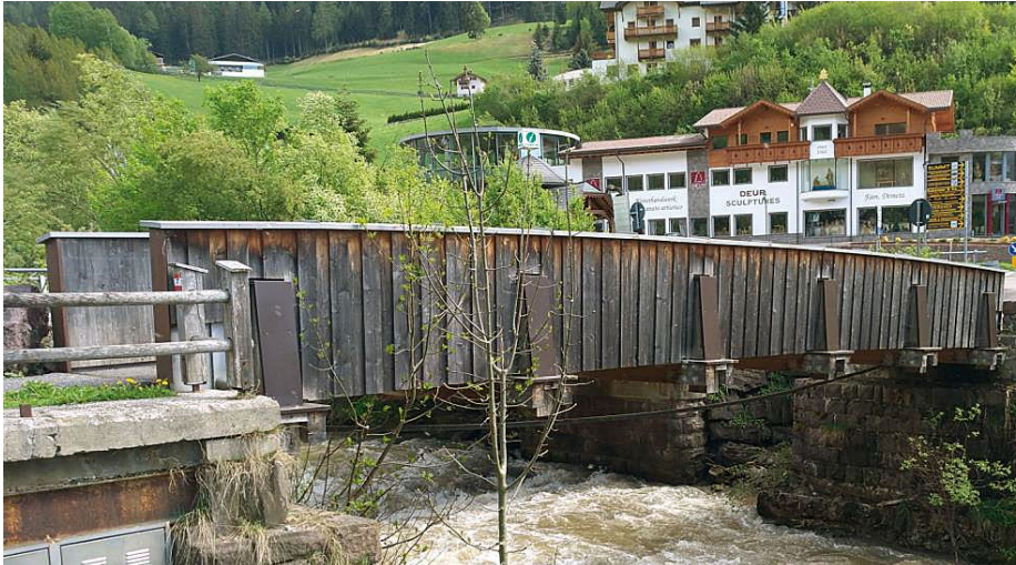
L vedl puent per chëi che va a pe

fé su i ëures dl puent, ulache l sarà l tretuar y la streda per la rodes. La firma BAUCON de Bulsan à laurà ora l proiet. I lëures unirà scric ora per ndut 1.230.265 euro, de chisc 900.571 euro per lëures da scri ora y 329.694 euro per somes a despusizion dl'aministrazion.