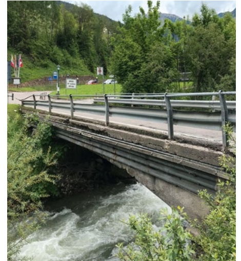
L puent ie melciafià