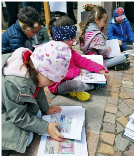
Uni muta y mut dla scolina à giapà n liber.

I mëndri dla scolina “Egaburvanda” de S.Cristina à pudù scuté su chësta stories tla Bibliotech “Tresl Gruber” y à giapà scincà l liber “Pitla stories dla bonanuet”. L cunsëi dla Bibliotech “Tresl Gruber” à nvià n cunlaurazion cun l Chemun de S.Cristina duc i mëndri dla scolina y ntan trëi domesdis ti à n valguna cumëmbres