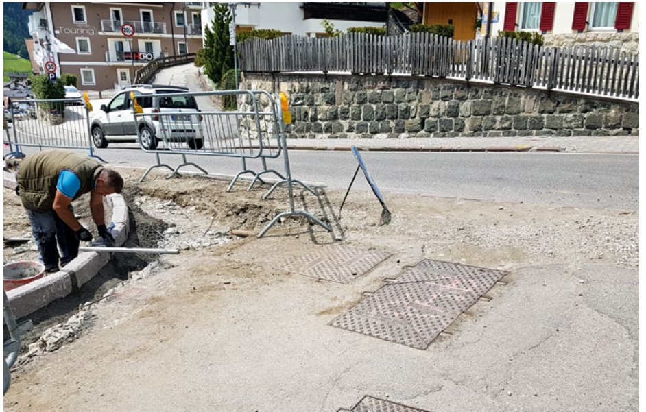
Ntan i lëures pra l trêbe dla streda Bënnunì cun la streda Dursan.

L vën prià bel de lascé i auti tla lueges seniedes y nia sun tretuars o ulache l ie pruibì, per la segurèza dla jënt che va a pe, cun bagli o cun la roda. L vën damandà n pue' de respet da pert de duc, per pudèi manejé a puntin dut l trafich sun la stredes, la promenades y i troies.