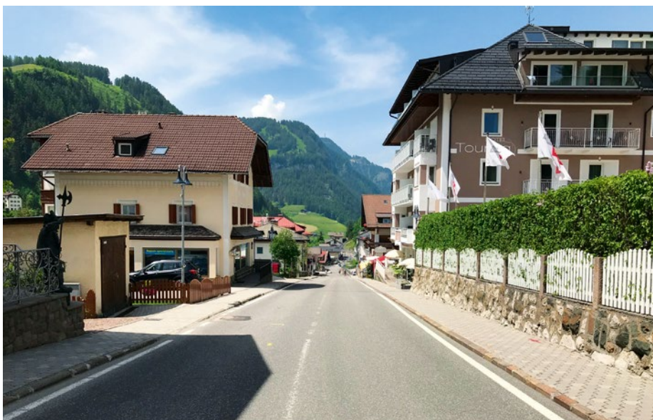
Te chësc tòch de streda danter l Hotel Post y l Hotel Cristallo possen dai 6 de lugio ai 31 de agost mé furné suvier.

Nuvità: Bën 8 iedesc al di (4 iedesc danmesdì y 4 domesdì) iel na curiera che furnea da Plaza Dosses nchin sun la plaza dai auti Cristauta. L'aministrazion nvieia duc de se nuzé de chësta puscibltà.